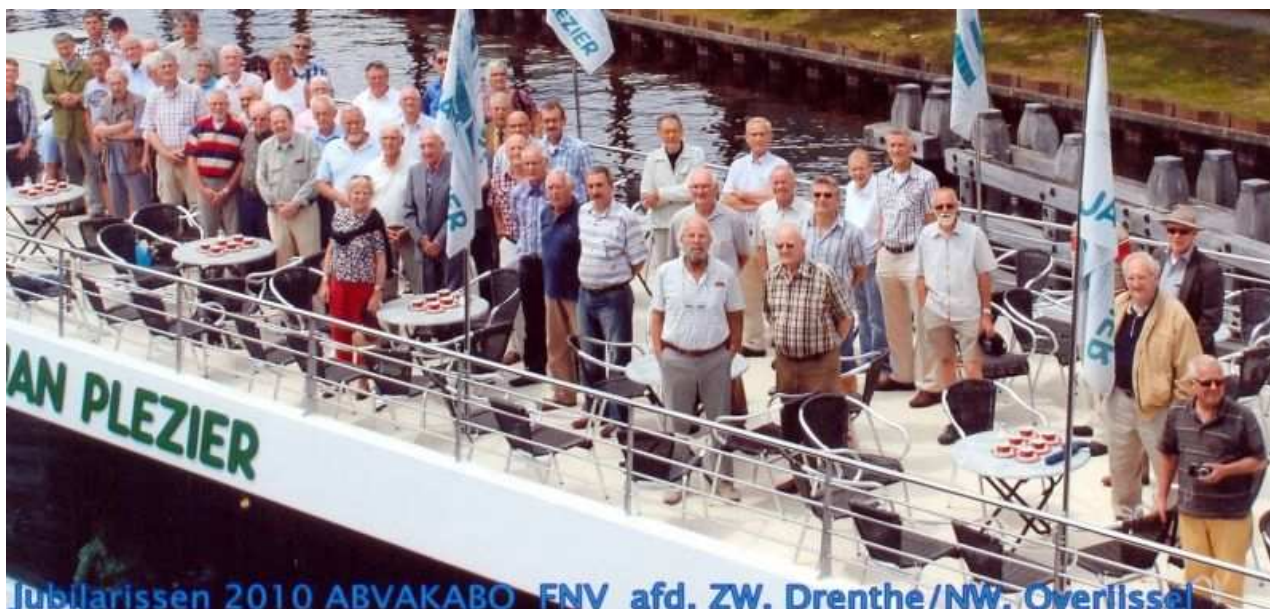
Jubilarissen aan boord van de rondvaartboot.